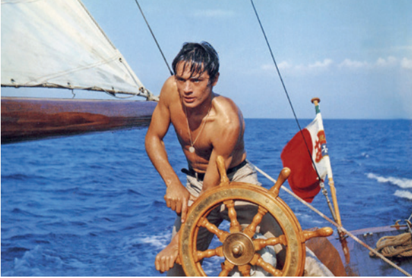
Plein soleil (Nur die Sonne war Zeuge), René Clément, F/I 1959

In memoriam: Alain Delon – schillernde Ikone des europäischen Kinos