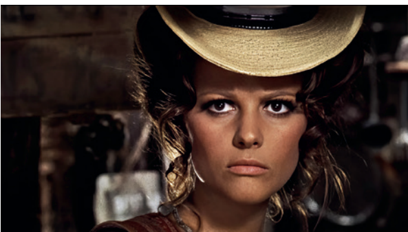
C'era una volta il West, Sergio Leone, US/I 1968