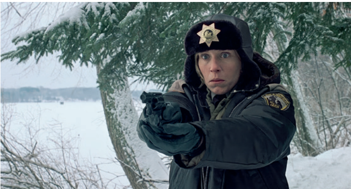
Fargo, Coen Brothers, UK/US 1996